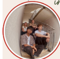
4 TEENS BAND