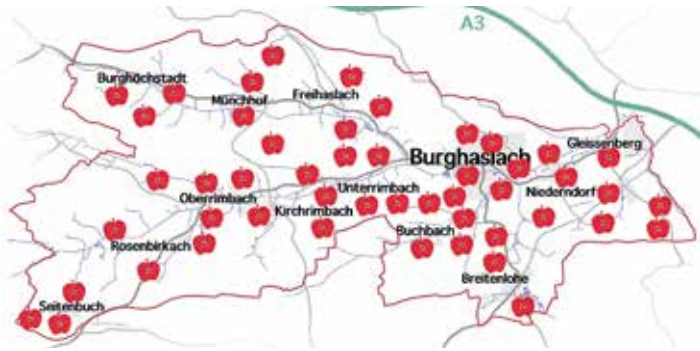
Streuobst im Gemeindegebiet (Ansicht unverbindlich und ohne Anspruch auf Vollständigkeit)