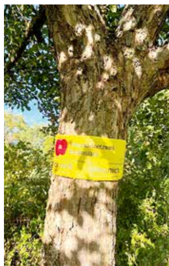
Streuobstbaum mit Banderole "Pflück mich - Pfleg mich"

Dazu zählen zum Beispiel kreative Aktionen wie die Banderolen „Pflück mich – Pfleg mich“ im Herbst, die dazu einladen, Obst von Streuobstbäumen zu ernten und gleichzeitig Verantwortung für deren Pflege zu übernehmen. Darüber hinaus wurden zahlreiche Baumpflanzaktionen für Kinder und Erwachsene organisiert, bei denen neue Obstbäume gesetzt wurden, um den Fortbestand der Streuobstwiesen langfristig zu sichern. Fachvorträge, Schnittkurse, zum Beispiel entlang der Kneipanlage in Burghaslach und Vogelstimmenwanderungen haben zudem vielen Interessierten die ökologische Bedeutung und praktische Pflege nähergebracht.