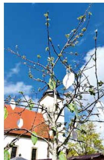
Wunschbaum am Frühjahrsmarkt Burghaslach mit Wünschen für Streuobstwiesen, Natur und Artenvielfalt