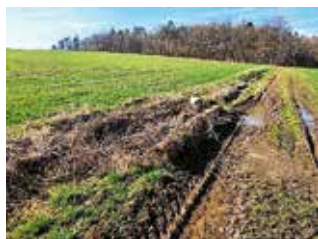
Traubenberg an der ST2257 Richtung Dürrnbuch