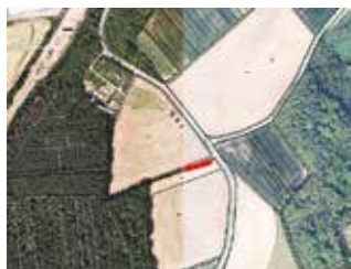
Traubenberg an der ST2257 Richtung Dürrnbuch