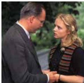
Ulrich Tukur und Johanna Klante in den Rollen von Dietrich Bonhoeffer und Maria von Wedemeyer.

Mit dem Film „Bonhoeffer – Die letzte Stufe“ (89 Min.) erinnern wir an die Ermordung des Theologen Dietrich Bonhoeffer vor 80 Jahren am 9. April 1945. Am 5.4.1943 wurde er von der Gestapo verhaftet. Der Vorwurf: Verschwörung und Hochverrat. Tatsächlich war Bonhoeffer zeitlebens ein erbitterter Gegner des Nazi-Regimes. Während der monatelangen Verhöre durch die Gestapo hoffte Bonhoeffer auf einen Sturz des Systems. Die Möglichkeit zur Flucht, vorbereitet von seiner Geliebten Maria von Wedemeyer, schlug er aus. Nach dem Scheitern des Hitler-Attentats vom 20. Juli 1944 wurde Bonhoeffer ins KZ Flossenbürg deportiert, wo er kurz vor Kriegsende erhängt wurde. Sehr bekannt ist sein Gedicht an Maria zum Weihnachtsfest 1944: „Von guten Mächten treu und still umgeben“. Der Filmabend beginnt am Sonntag, 13.4.2025, um 19:30 Uhr im Saal der LKG in Wasserberndorf.